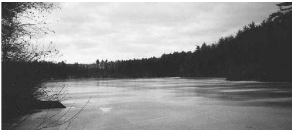
Walden Pond, iced over. Photo copyright 1998

睡过了一个安静的冬天的夜晚，而醒来时，印象中仿佛有什么问题在问我，而在睡眠之中，我曾企图回答，却又回答不了——什么——如何——何时——何处？可这是黎明中的大自然，其中生活着一切的生物，她从我的大窗户里望进来，脸色澄清，心满意足，她的嘴唇上并没有问题。醒来便是大自然和天光，这便是问题的答案。雪深深地积在大地，年幼的松树点点在上面，而我的木屋所在的小山坡似乎在说：“开步走！”大自然并不发问，发问的是我们人类，而它也不作回答。它早就有了决断了。“啊，王子，我们的眼睛察审而羡慕不置，这宇宙的奇妙而多变的景象便传到了我们的灵魂中。无疑的，黑夜把这光荣的创造遮去了一部分；可是，白昼再来把这伟大作品启示给我们，这伟大作品从地上伸展，直到