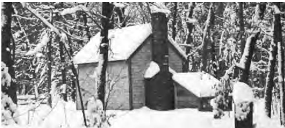
Replica of Walden hut in winter, showing the chimney and woodshed

我遭逢了几次快乐的风雪，在火炉边度过了一些愉快的冬夜，那时外面风雪狂放地旋转，便是枭鹰的叫声也给压下去了。好几个星期以来，我的散步中没有遇到过一个人，除非那些偶尔到林中来伐木的，他们用雪车把木料载走了。然而那些大风大雪却教会我从林中积雪深处开辟出一条路径来，因为有一次我走过去以后，风把一些橡树叶子吹到了被我踏过的地方；它们留在那里，吸收了太阳光，而溶去了积雪，这样我不但脚下有了干燥的路可走，而且到晚上，它们的黑色线条可以给我引路。至于与人交往，我不能不念念有辞，召回旧日的林中居民。照我那个乡镇上许多居民的记忆，我屋子附近那条路上曾响彻了居民的闲谈与笑声，而两旁的森林，到处斑斑点点，都曾经有他们的小花园和小住宅，虽然当时的森林，比起现在来，还要浓密得多。在有些地方，我自己都记得的，浓密的