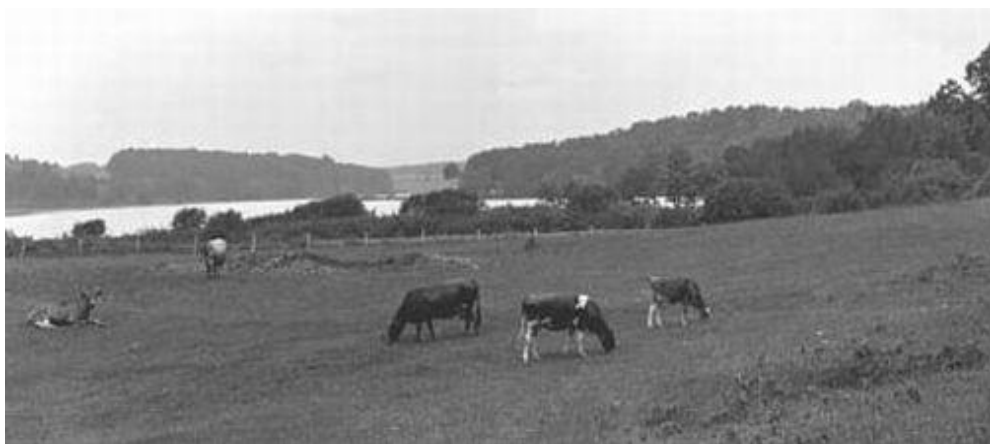
Baker Farm, June 1903

有时我徜徉到松树密林下，它们很像高峙的庙宇，又像海上装备齐全的舰队，树枝像波浪般摇曳起伏，还像涟漪般闪烁生光，看到这样柔和而碧绿的浓荫，便是德罗依德 ① 也要放弃他的橡树林而跑到它们下面来顶礼膜拜了，有时我跑到了蕪灵特湖边的杉木林下，那些参天大树上长满灰白色浆果，它们越来越高，便是移植到伐尔哈拉 ② 去都毫无愧色，而杜松的盘绕的藤蔓，累累结着果实，铺在地上；有时，我还跑到沼泽地区去，那里的松萝地衣像花彩一样从云杉上垂悬下来，还有一些菌子，它们是沼泽诸神的圆桌，摆设在地面，更加美丽的香蕈像蝴蝶或贝壳点缀在树根；在那里淡红的石竹和山茱萸生长着，红红的枳果像妖精的眼睛似地闪亮，蜡蜂