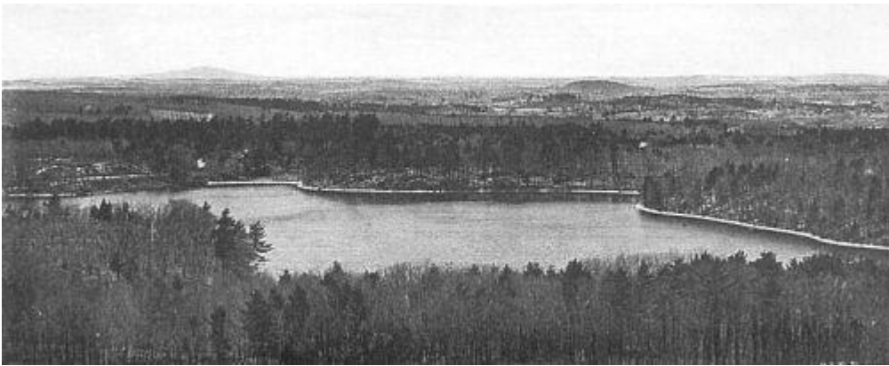
Walden Pond from Pine Hill, by Herbert W. Gleason, circa 1900.

到达我们生命的某个时期，我们就习惯于把可以安家落户的地方，一个个地加以考察了。正是这样我把住所周围一二十英里内的田园统统考察一遍。我在想象中已经接二连三地买下了那儿的所有田园，因为所有的田园都得要买下来，而且我都已经摸清它们的价格了。我步行到各个农民的田地上，尝尝他的野苹果，和他谈谈稼穡，再又请他随便开个什么价钱，就照他开的价钱把它买下来，心里却想再以任何价钱把它押给他；甚至付给他一个更高的价钱，——把什么都买下来，只不过没有立契约，——而是把他的闲谈当作他的契约，我这个人原来就很爱闲谈，——我耕耘了那片田地，而且在某种程度上，我想，耕耘了他的心田，如是尝够了乐趣以后，我就扬长而去，好让他继续耕耘下去。这种经营，竟使我的朋友们当我是一个地产掮客。其实我是无论坐在哪里，都能够生活的，哪里的风景都能相应地为我而