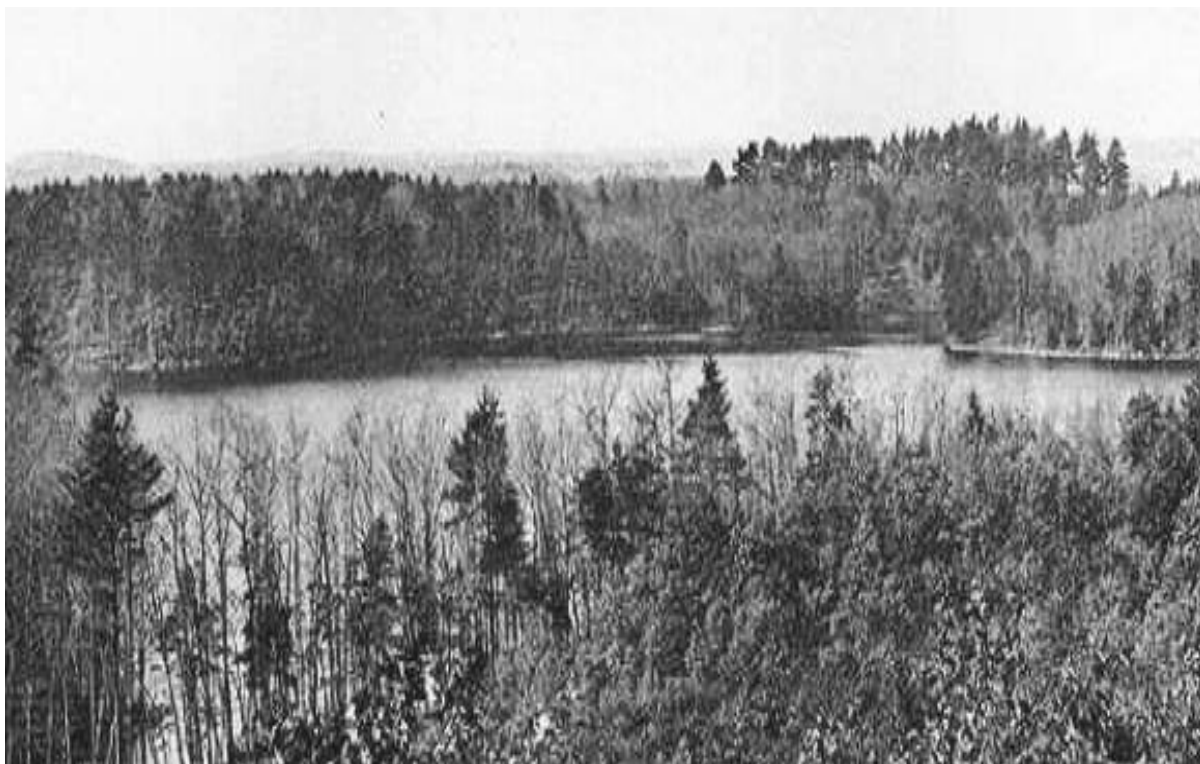
From a 1906 edition of Thoreau's works, part of Walden Pond from Emerson's Hill. Thoreau's cabin was across the pond, at the cove by the tall pines. Beyond the cove, the walk to town is about one mile.

当我写后面那些篇页，或者后面那一大堆文字的时候，我是在孤独地生活着，在森林中，在马萨诸塞州的康科德城，瓦尔登湖的湖岸上，在我亲手建筑的木屋里，距离任何邻居一英里，只靠着我双手劳动，养活我自己。在那里，我住了两年又两个月。目前，我又是文明生活中的过客了。