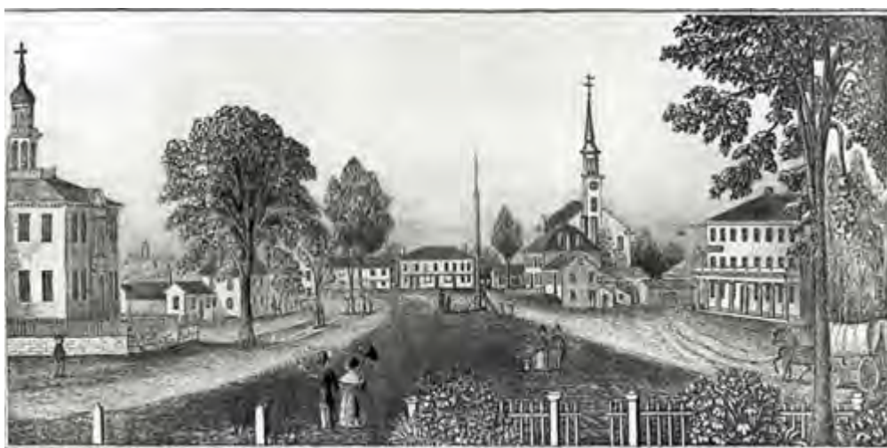
Concord in 1839 - by J.W. Barber, courtesy

锄地之后，上午也许读读书，写写字，我通常还要在湖水中再洗个澡，游泳经过一个小湾，这却是最大限度了，从我身体上洗去了劳动的尘垢，或者除去了阅读致成的最后一条皱纹，我在下午是很自由的。每天或隔天，我散步到村子里去，听听那些永无止境的闲话，或者是口口相传的，或者是报纸上互相转载的，如用顺势疗法小剂量的接受它们，的确也很新鲜，犹如树叶的瑟瑟有声和青蛙的咯咯而鸣。正像我散步在森林中时，爱看鸟雀和松鼠一样，我散步在村中，爱看一些男人和孩童；听不到松涛和风声了，我却听到了辘辘的车马声。从我的屋子向着一个方向望过去，河畔的草地上，有着一个麝鼠的聚居地；而在另一个地平线上，榆树和悬铃木底下，却有一个满是忙人的村子，使我发生了好奇之心，仿