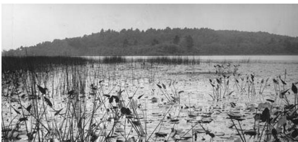
Pond Lilies at Fair Haven Bay, 1900

有时，对人类社会及其言谈扯淡，对所有村中的友人们又都厌倦了，我便向西而漫游，越过了惯常起居的那些地方，跑到这乡镇的更无人迹的区域，来到“新的森林和新的牧场”上；或当夕阳西沉时，到美港山上，大嚼其越橘和浆果，再把它们拣拾起来，以备几天内的食用。水果可是不肯把它的色、香、味给购买它的人去享受的，也不肯给予为了出卖它而栽培它的商人去享受的。要享受那种色、香、味只有一个办法，然而很少人采用这个办法。如果你要知道越橘的色、香、味，你得请问牧童和鹧鸪。从来不采越橘的人，以为已经尝全了它的色、香、味，这是一个庸俗的谬见。从来没有一只越橘到过波士顿，它们虽然在波士顿的三座山上长满了，却没有进过城。水果的美味和它那本质的部分，在装上了车子运往