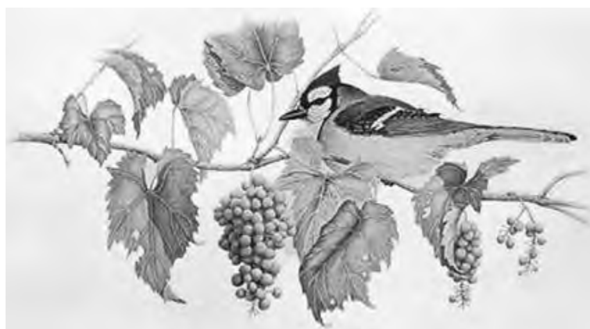
Blue Jay with Wild Grapes by Layne Larsen

10月中，我到河岸草地采葡萄，满载而归，色泽芬芳，胜似美味。在那里，我也赞赏蔓越橘，那小小的蜡宝石垂悬在草叶上，光莹而艳红，我却并不采集，农夫用耙耙集了它们，平滑的草地凌乱不堪，他们只是漫不经心地用蒲式耳和金元来计算，把草地上的劫获出卖到波士顿和纽约；命定了制成果酱，以满足那里的大自然爱好者的口味。同样地，屠夫们在草地上到处耙野牛舌草，不顾那被撕伤了和枯萎了的植物。光耀的伏牛花果也只供我眼睛的欣赏：我只稍为采集了一些野苹果，拿来煮了吃，这地方的地主和旅行家还没有注意到这些东西呢。栗子熟了，我藏了半蒲式耳，预备过冬天。这样的季节里，倘佯在林肯一带无边无际的栗树林中，真是非常兴奋的，——现在，这些栗树却长眠在铁道之下了，——